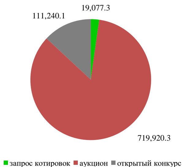
сумма НМЦК, тыс. руб.

По состоянию на 01.10.2022 года заказчиками заключены 934 контракта на общую сумму 5 245 225,76 тыс. руб., 31 контракт на общую сумму 81 920,97 тыс. руб. находятся на стадии заключения.