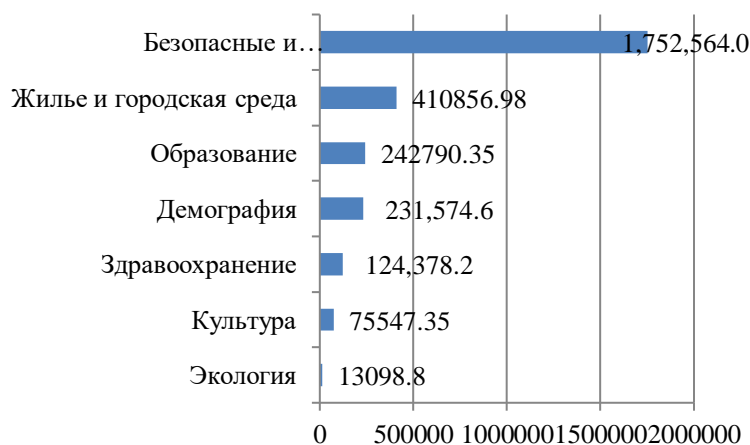
сумма НМЦК, тыс. руб.

Так, в рамках реализации национального проекта «Безопасные и качественные автомобильные дороги» проведены электронные аукционы по ремонту автомобильных дорог в г. Элиста Республики Калмыкия общей суммой НМЦК – 133 581,21 тыс. руб.